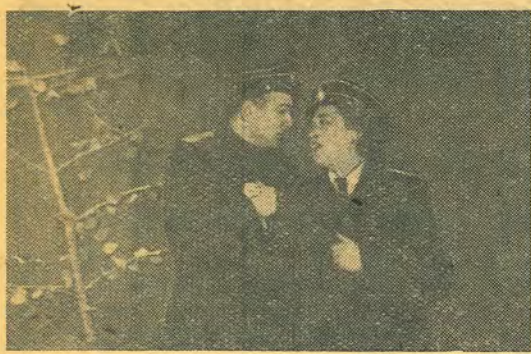
Сцена из спектакля «Второе дыхание».

При обсуждении спектакля «Второе дыхание» А. Крона, поставленного силами наших студентов, мнения разделились. Поэтому редакция считает возможным опубликовать две рецензии, выражающие разные точки зрения.