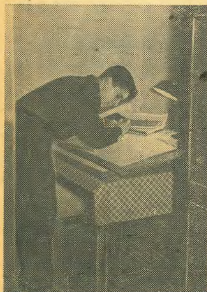
Некоторые предпочитают и в субботу заниматься.