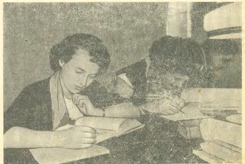
Способ обыкновенный. (См. 2-ю стр.)